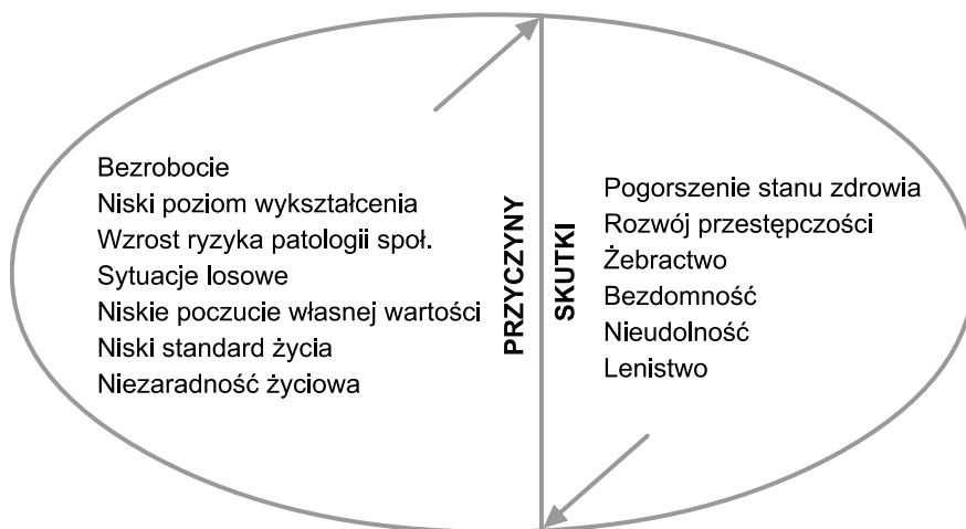
Rys. 1. Koło przyczynowo-skutkowe ubóstwa